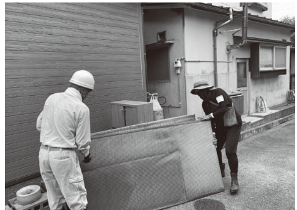
被災家財の片付け