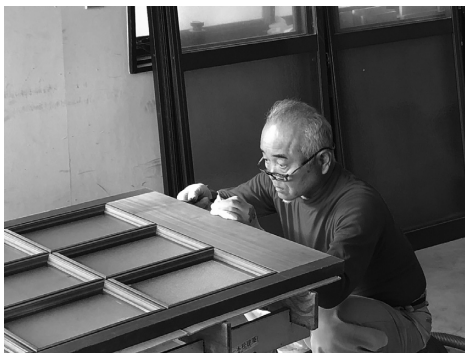
手際よく戸の調整をしました

10月15日(日)に東播建設労働組合但馬支部香住分会が家の簡単な修繕ボランティアを行いました。 この分会では、例年、一人暮らし高齢者を対象に、ボランティア活動をされています。 台風7号を受け、被災された方に職人の技術を活かして自分たちに何かできることはないかと話があり、例年の活動に加え、今回の活動につながりました。 当日は、6名の組合員が集まり、間室区の対象世帯2件