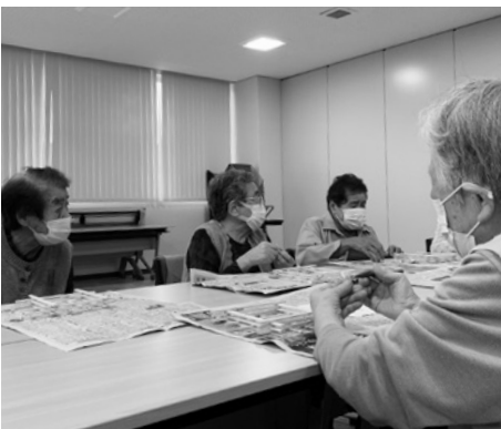
▲体操だけでなく、手芸や数独などの脳トレもします

体を動かす習慣作りは、運動の習慣をつけるだけでなく、ボランティア活動への参加や地