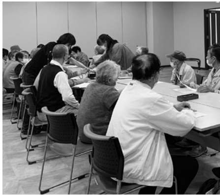
▲血圧や体温などの健康チェックもします

介護について知り、考えることはもちろん大切ですが、健康寿命を延ばして、介護サービスを利用していく時期を遅らせることも大切です。