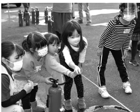
親子防災体験 イザ！カエルキャラバンin香美