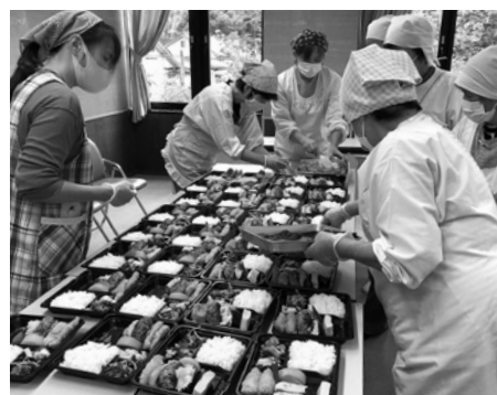
給食ボランティア活動