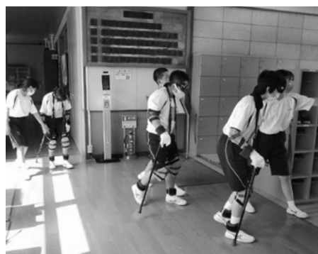
町内小中学校での福祉体験授業