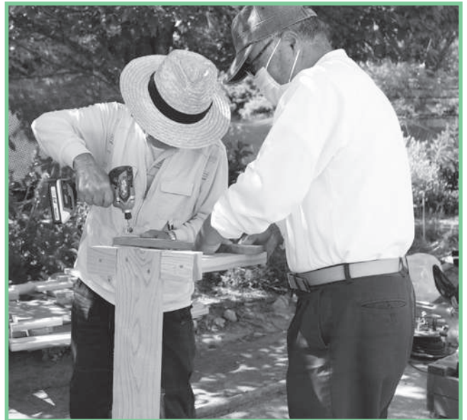
スノーボードベンチづくり(香住区)