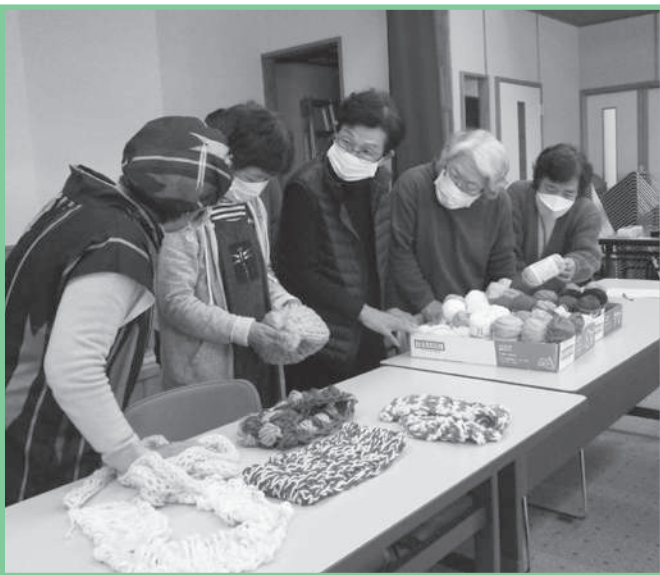
冬のつどい場「編み物教室」(小代区)