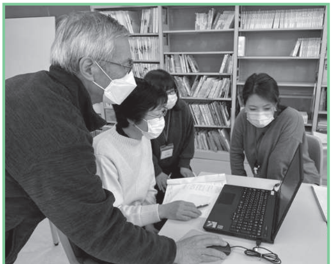
ボランティア活動支援(朗読ボランティアそよかせ 村岡区)