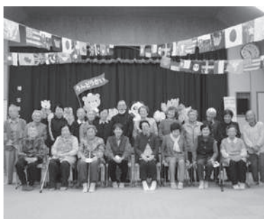
3教室合同での運動会!! 懐かしい顔に会えるかも?!

こうなる前に、定期的な運動習慣をつけて予防していきましょう。もし、当てはまってしまっても、