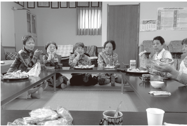
▲住民のみなさまの声を社協に届けていきます

町内の福祉等関係者の方々が、評議員として参加し、審議をしていただくことにより、社会福祉協議会は、地域に根ざした運営を今後より一層進めていくようになります。