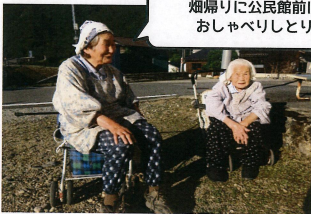
畑帰りに公民館前に集って おしゃべりしとります♪