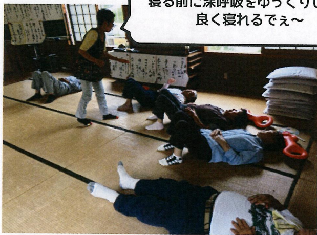
寝る前に深呼吸をゆっくりしたら 良く寝れるでえ〜