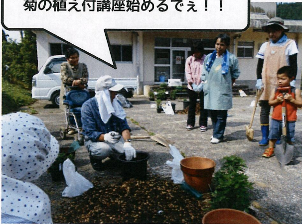
菊の植え付講座始めるでえ！！