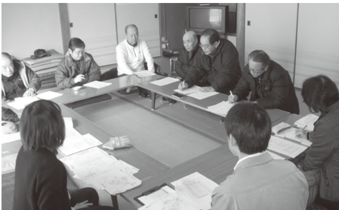
▲ 福祉委員会（村岡区）

「善意の日」は「みんなの小さな善意が重なって、世の中が明るくなるものであり、県民だれもがこの日一つ善行をしてもらいたい」との思いから、昭和39年に定められた兵庫県独自の取り組みです。香美町善意銀行では、平成26年度も町民の皆さまから、たくさんのご預託をいただきました。