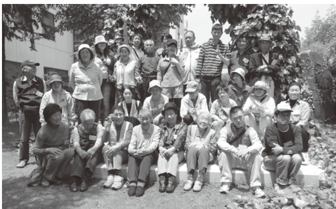
▲ 日頃外出が難しい人も、ボランティアと一緒に出かけ♪

「善意の日」は「みんなの小さな善意が重なって、世の中が明るくなるものであり、県民だれもがこの日一つ善行をしてもらいたい」との思いから、昭和39年に定められた兵庫県独自の取り組みです。香美町善意銀行では、平成26年度も町民の皆さまから、たくさんのご預託をいただきました。