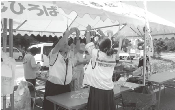
▲ ハートフルフェスタでは香住高校ボランティア部と一緒に活動

500人委員会香住OB会では年間を通していろいろな活動に取り組んでいます。5月には、香住第二中学校の生徒と一緒に香住区訓谷浜の清掃活動を行い、自然を思いやる機会としていきます。