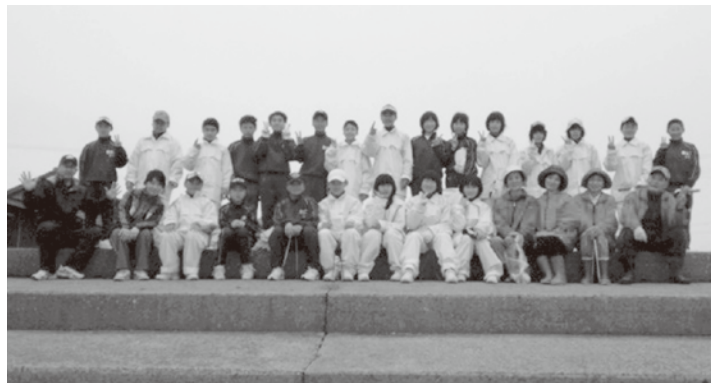
▲ 香住第二中学校の生徒と訓谷浜の清掃活動

夏には香住ふるさと祭り、秋には福祉まつりやハートフルフェスタで子ども広場を開設して、バレーコートやしゃぼん玉作りで子どもたちと楽しい時間を過ごします。