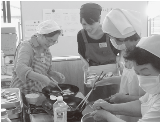
▲ 村岡・香住調理ボランティア交流会