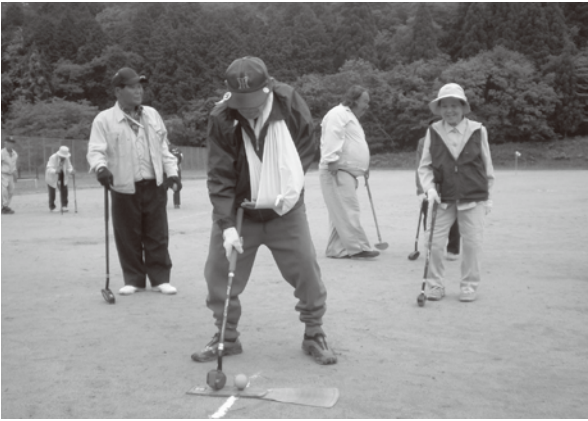
▲ 身体障害者福祉協会グラウンドゴルフ大会（小代区）