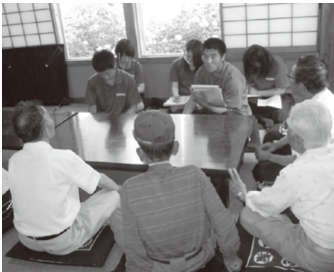
▲村岡高校福祉学習。地域を訪問し、生活の中の困りごとなどをお聞きました。

③ ボランティア活動・市民活動への支援 ：災害ボランティアなど専門分野のボランティアとのつながり、また海岸清掃や除雪ボランティア活動を通し、町内の支えあい体制づくりを進めます。