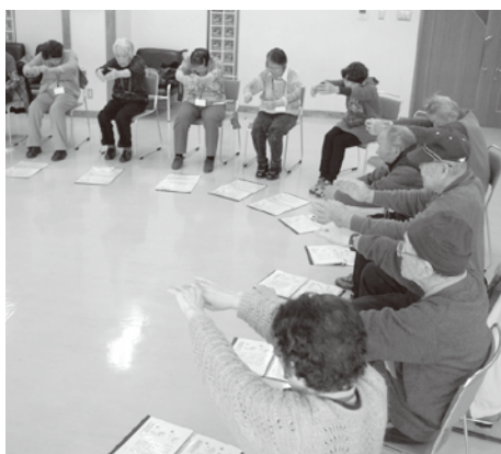
▲元気デイサービスで介護予防！

② 社会福祉協議会組織体制強化 ：介護職員初任者研修（訪問介護員養成研修）の実施に向