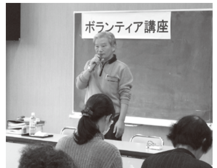
▲ 新温泉町で開催された「防災・減災ボランティア講座」に講師として参加。講演のほかに、非常持出袋の重さを体感するワークショップも行ないました。