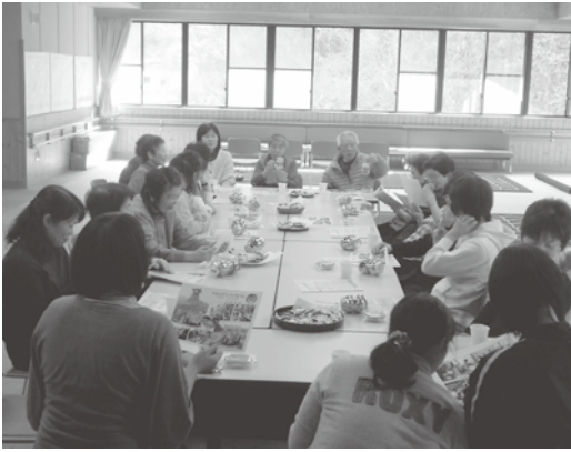
▲小代区では3月26日にレクリエーションと情報交換会を行いました。

在宅介護者は、介護中心の生活になりやすく孤立しがちになるといわれています。介護者同士が同じような体験を共有し、共感することは孤立感の軽減につながります。ま