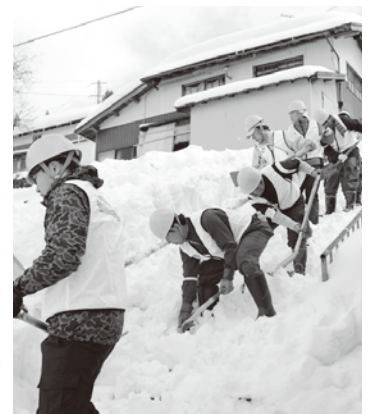
▲除雪ボランティア「困った時はお互い様」

⑤ 災害にも強い支援体制の推進 ：福祉・防災マップ（危険箇所・資源）を見直し、全戸配布します。