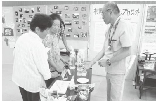
▲ 村岡福祉まつりで、住民向けに非常食の説明