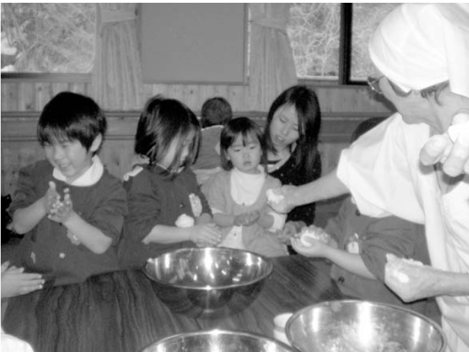
▲ おだんごまるめるのってたのしいね