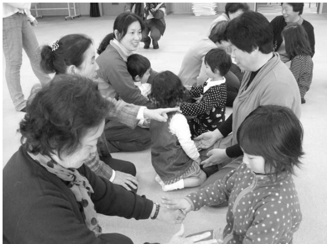
▲おばあちゃん、手あそびってたのしいね

やべって、小さなお子さんたちと手をにぎったり幸せでした」などと、にこやかに話されていました。