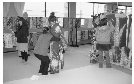
▲選んで試着して写真をパチリ。 本番が楽しみです！