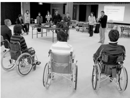
▲ 実際に福祉体験をする教諭の皆さん

参加した教諭からは、「学校現場では、いつも子どもたちに体験させる立場のため、実際に自分自身が体験することで違った視点で子どもに話ができそうだ」「今後学校だけでなく、自分の住んでいる町に出てみることで住みよい町づくりになるのでは」といった意見が聞かれました。