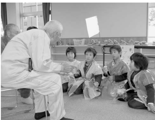
▲グループホーム入居者の方々と交流する児童

11月4日(木)、射添小学校1、2年生が日頃の学習の成果を発表しようと、グループホームむらおかのかの空の入居者を学校にお招きし、交流会「あつまれ!あきフェスタ」を行いました。 当日は、児童と入居者の方が一緒にゲームをしたり、児童手作りののはっぴのファッションショーを見せていただいたり、最後には手作りのスイートポテトをいただきながら、お話をしながら交流しました。グループホームの方は、「子どもの姿を見るだけでうれしいなあ。自然に笑顔になるなあ」とニコニコと話されました。