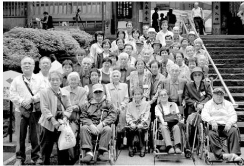
▲永平寺で記念撮影をする参加者

来年の約束をしながらバスを降りていかれる人たちのあたたかい心がじんじん伝わってきます。