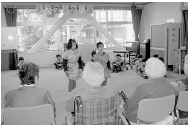
▲はっぴのファッションショー