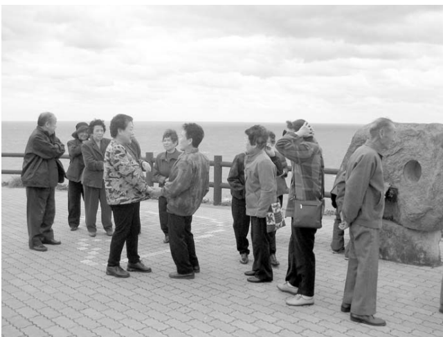
▲「お久しぶり。元気だった？」と声をかけあう参加者の方

「ひとりではなかなか買い物も行けないし、みんなと一緒にだと楽しくて、ついつい買いすぎたわ。」と笑いながらお話ししてくださいました。