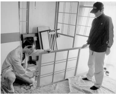
▲戸の修理をする組合員の方々

11月7日(日)、香住区内の大王、左官、板金工等で構成する東播建設労働組合但馬支部香住分会による一人暮らし高齢者宅の補修作業が行われました。これは毎年組合員の方々が、地域に貢献しようとしてボランティア活動としてされているもので、今年は、戸車の修理や樋の修理など計9件が実施されました。修理を希望された高齢者の方々は、「大変よくしていただけて助かりました。」と喜んでおられました。