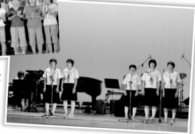
▲香住二中の生徒が作曲した「絆」

ふれあいコンサートは、来場者、出演者などたくさんの方のご協力を得て作り上げるコンサートです。一緒にこの歴史あるコンサートを続け、盛り上げていきませんか？お手伝いしてくださる方は、香美町社会福祉協議会香住支所までお気軽にご連絡ください。