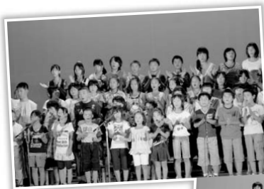
▲「ふれあいの心」を全員で合唱

「あらたな一歩」のひとつとして、今年は、発表曲16曲のほとんどが新曲であることに加え、介助犬のデモンストラーションや、香住ボランティア連絡会による「ハートフルフェスタ2010」が同時開催されました。