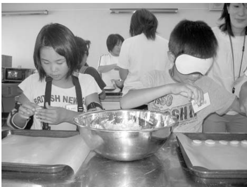
▲アイマスクや高齢者疑似体験をしながらクッキーを作りました。

「助ける」ということはとても大切なことじゃないかと、この体験で学びました。だから今後は不自由な人を助けていきたいなと思いました。