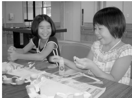
▲工夫しながらゲームを手作り 「喜んでもらえるかな」

「いきいきサロンに参加して、高齢者と仲良くなろう！」と小代小学校の児童13名が3回シリ