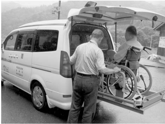
▲ リフト付車両で車いすやストレッチャーの方も乗り降りが楽にできます。