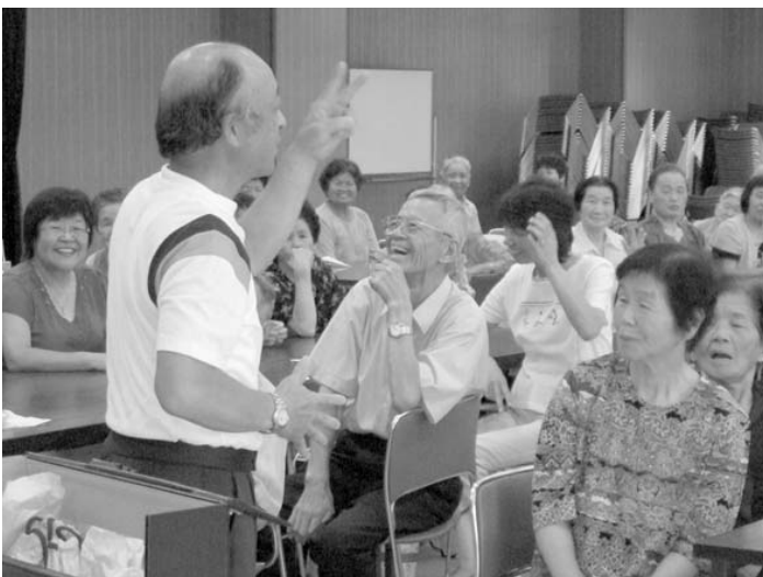
▲ ジャンケンゲームで盛り上がる参加者の皆さん