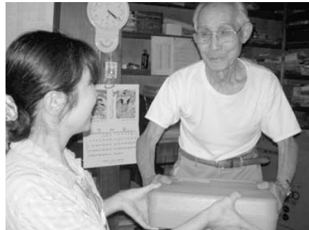
▲ 保温容器に入れてお届けします。

配食サービス利用申請書を香美町役場福祉課または各地域局健康福祉課に提出してください。利用決定は、香美町長が行います。