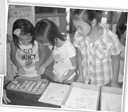
▲スタンプリアーをするとジオパークのバッジがもらえたよ