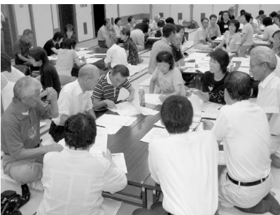
▲集落内の危険箇所について熱心に話し合う参加者の皆さん(兎塚会場)