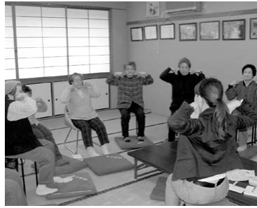
▲ 転びにくい体をつくる健康体操