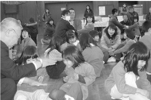
▲子どもからお年寄りまでがジャンケンゲームで交流

●手話の説明をやり終え、みんなと歌をうたっているとき、少しうれしくなりました。知らない人もいっしょに手を動かしてくれていることになんだか感動したのです。ややこしくて難しいあの手話がみんなにもすばらしいことを、私は改めて感じました。