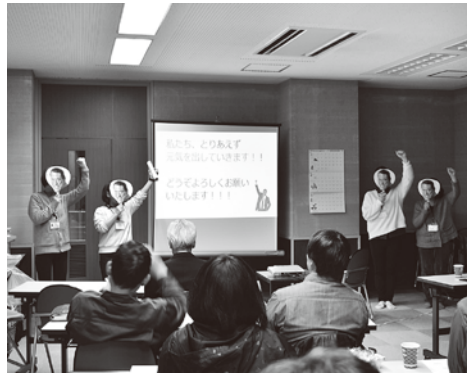
▲ 「ぎゃ〜なもんプロジェクト」説明会

社協では、少しでも下記の17の目標が達成に近づけられるよう、業務に取り組んでいきたいと考えています。ふだんのくらしの中で、少しSDGsを意識してみませんか？