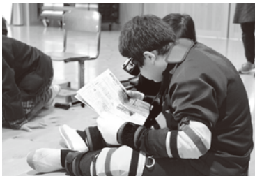
▲町内の各学校での福祉学習