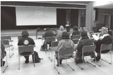
▲認知症啓発のための映画の上映会