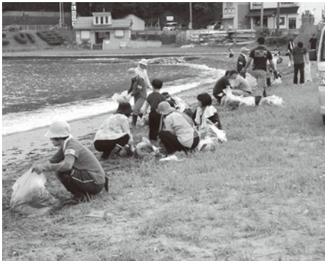
▲ 海岸清掃ボランティア

下記のマークを見ると、「3」は、社協の基本理念「ささえあい安心して暮らせるまちづくり」に、「11」は、先日、開催した未来の香美町を考える「ぎゃ〜なもんプロジェクト」に、「14」は、毎年、多くの方の協力を得て開催している海岸清掃ボランティアに通じる部分です。