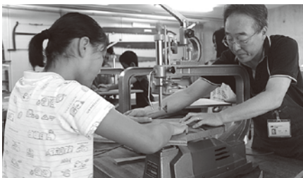
▲サマーボランティア体験教室