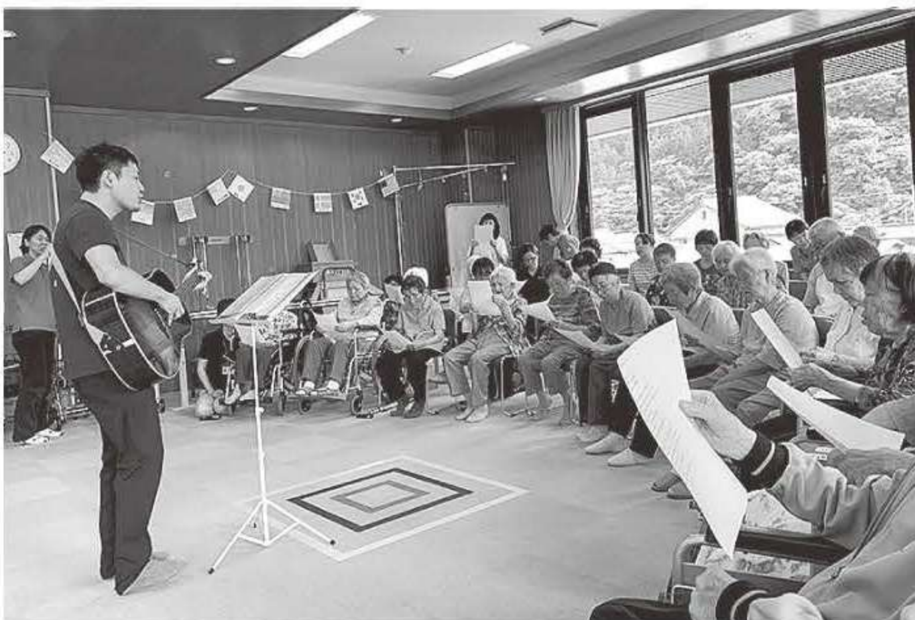
▲村岡デイサービスセンター