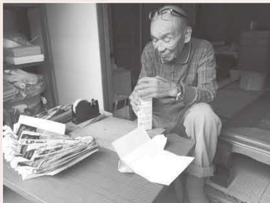
イス作り名人、御歳90歳！ (牛乳パックのイスづくり)

*お問い合わせ 香美町社会福祉協議会 本所 ☎(0796)3912050 村岡支所 ☎(0796)9811000 小代支所 ☎(0796)9712202