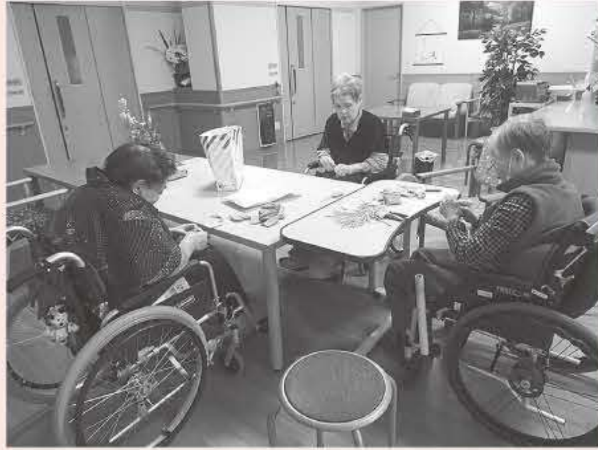
「わしらも何か役に立ちたい！」 (お守りづくり)

「香美町ぎやうなもんプロジェクト」は、町民自らが香美町の将来像を描くことで、誰もが自分らしく活躍できるまちづくりを目的と