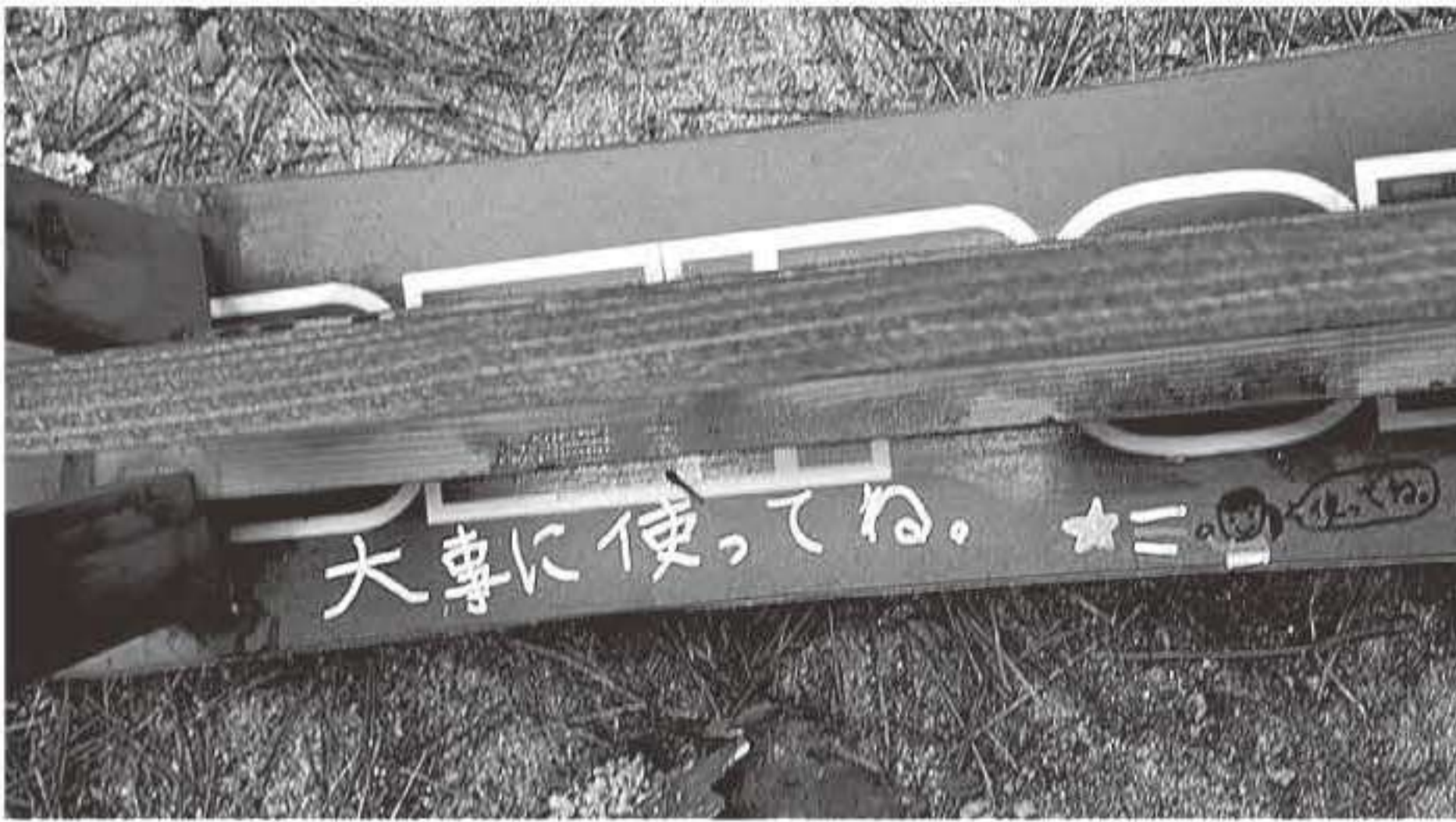
▲ベンチにもメッセージを書いています。探してみてください!