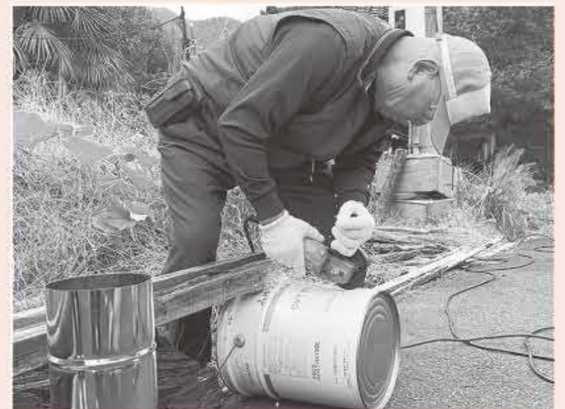
「ここはわしの出番だな！」 (ロケットストーブづくり)