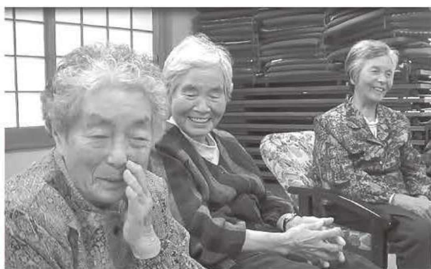
▲ここに来たら、ようけ笑えるなあ!

たりします。開催時間は午後1時半から3時半で、スタッフは3時半には片付けて帰るのですが、参加者の方は4時半頃まで残っておしゃべりをされています。 ● これから 高齢者だけでなく、幅広い年代の方に参加していただけたら、という思いはありますが、なかなか難しいです。 参加者のみなさんは、毎回とても楽しみにされているので、農繁期などには月1回の開催にし、茶話会中心であまり内容を考えなくても良いように工夫して、スタッフも無理なく楽しく続けられるように思っています。