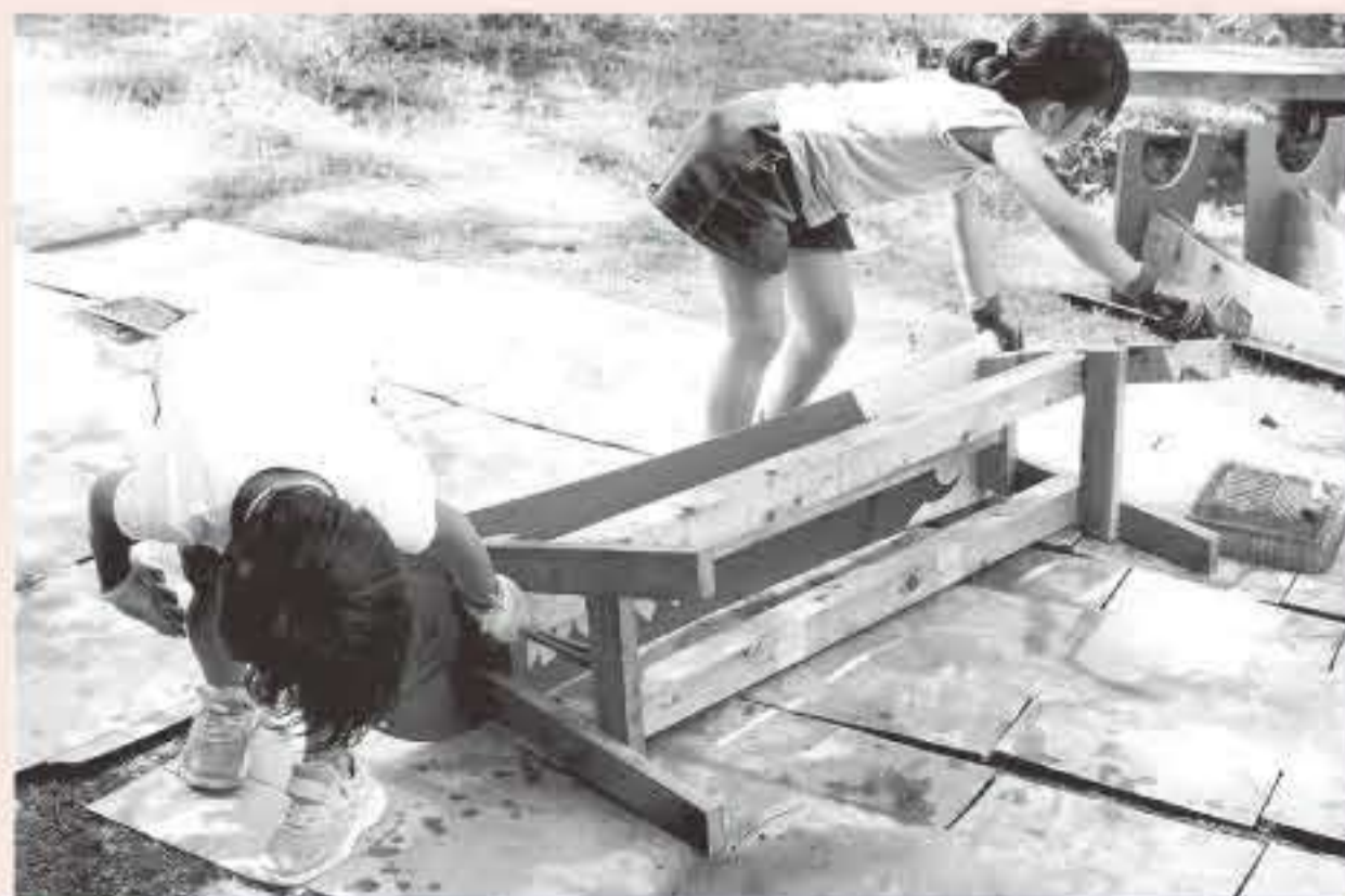
「防腐剤塗りはまかせて！上手でしょ？」 (スノーボードベンチづくり)