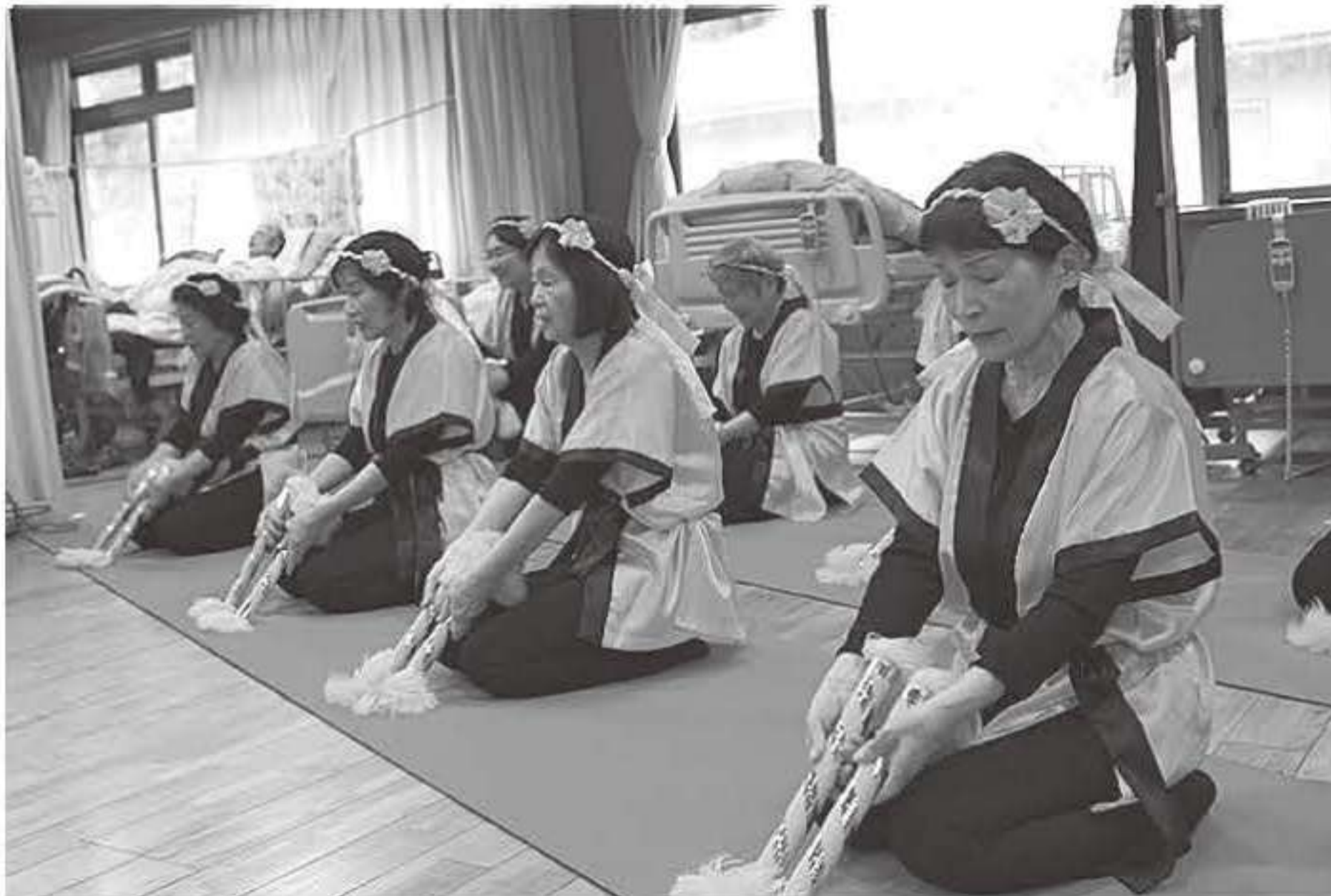
▲デイサービスセンター「ほほえみ」