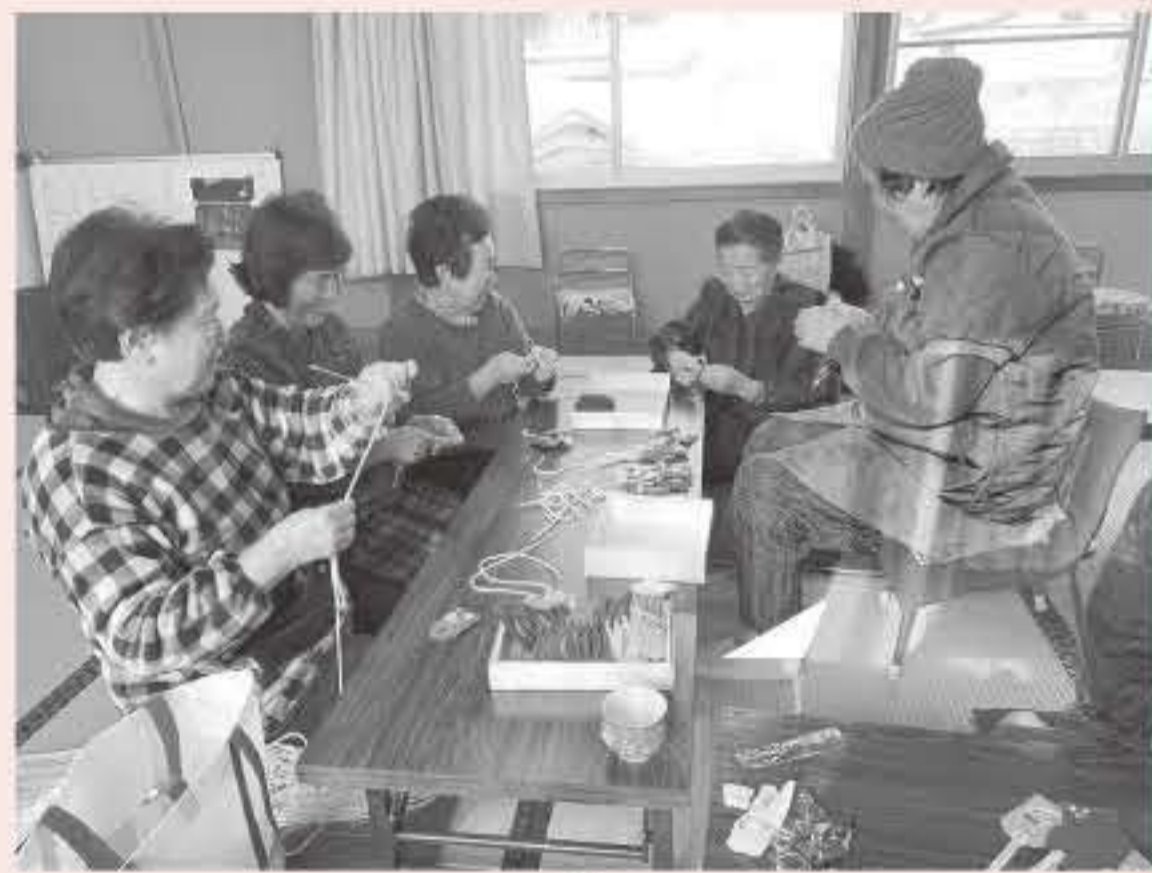
「みんなで作ったら楽しい♪」 (お守りづくり)

「香美町ぎやうなもんプロジェクト」は、町民自らが香美町の将来像を描くことで、誰もが自分らしく活躍できるまちづくりを目的と